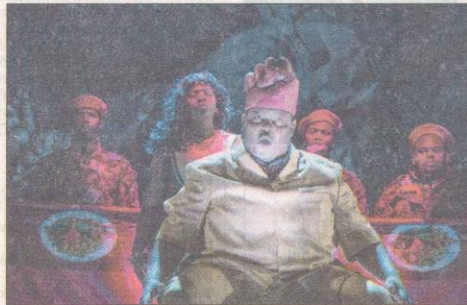
Un colorido contexto sudafricano da marco a la ópera de Verdi.

En el plano musical, cabe aclarar que se mezclan la música original